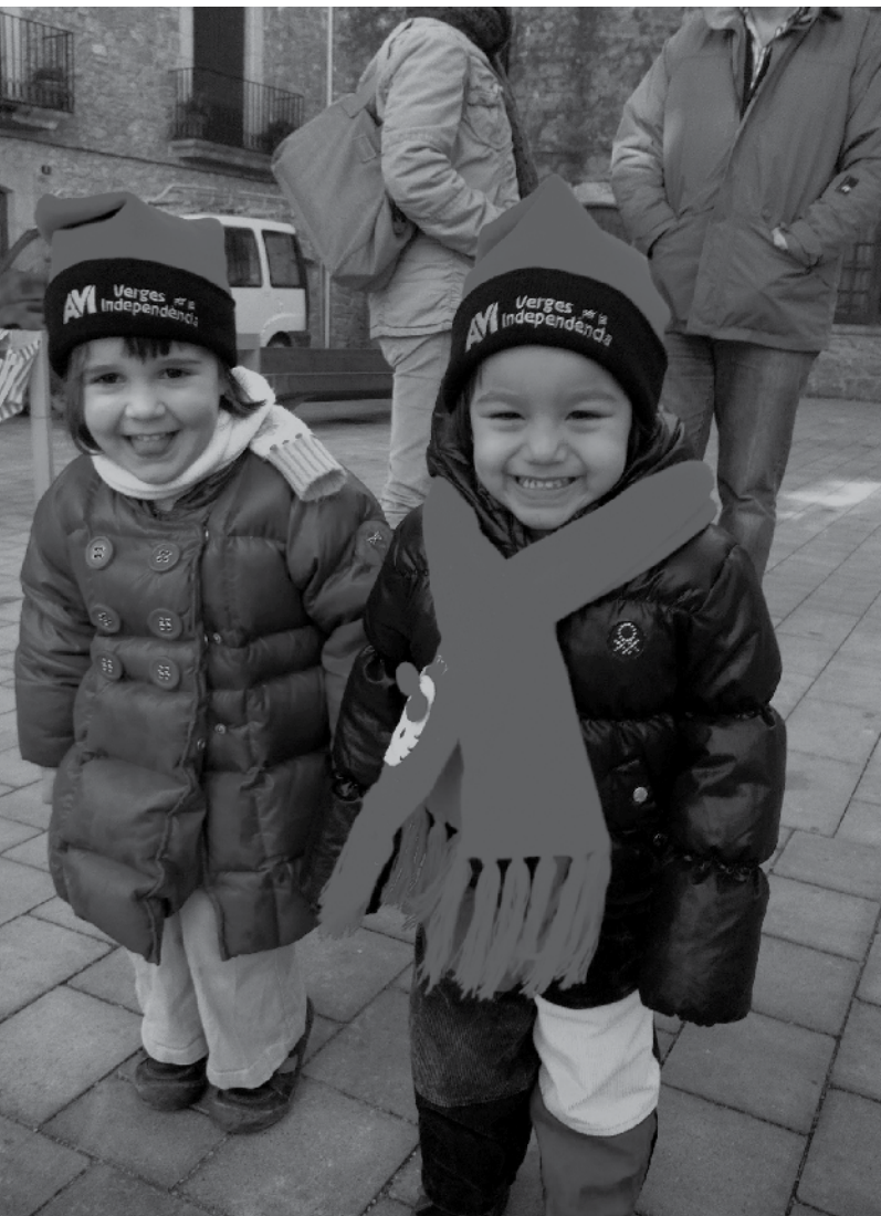
Independència ara i per als qui vindran

Ni consultes, ni dret a decidir, ni terceres vies, ni un nou pacte fiscal, ni encaix ni reforma constitucional. L'únic objectiu de l'AVI (Assemblea Vergelítana per la Independència) quan vam néixer a la tardor del 2009 era el mateix que encara ens mou actualment amb l'ANC de Verges: la independència de Catalunya.