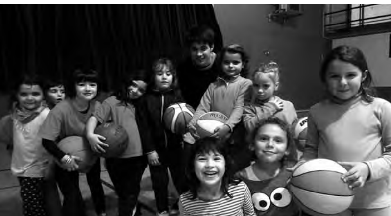
L'Escoleta del Club de Bàsquet Verges