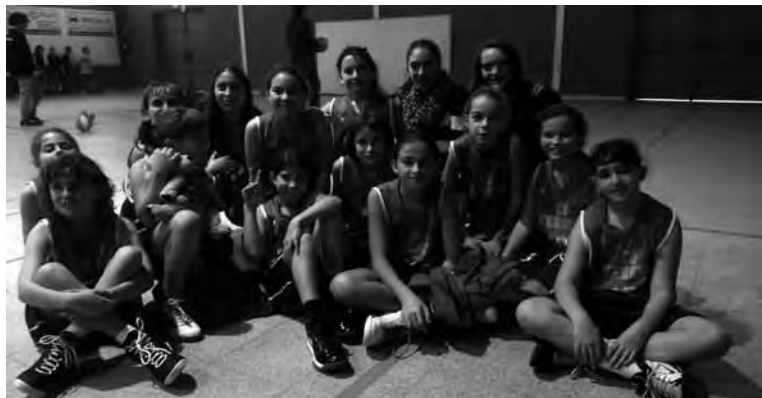
L'equip Mini femení, després de la seva primera victòria