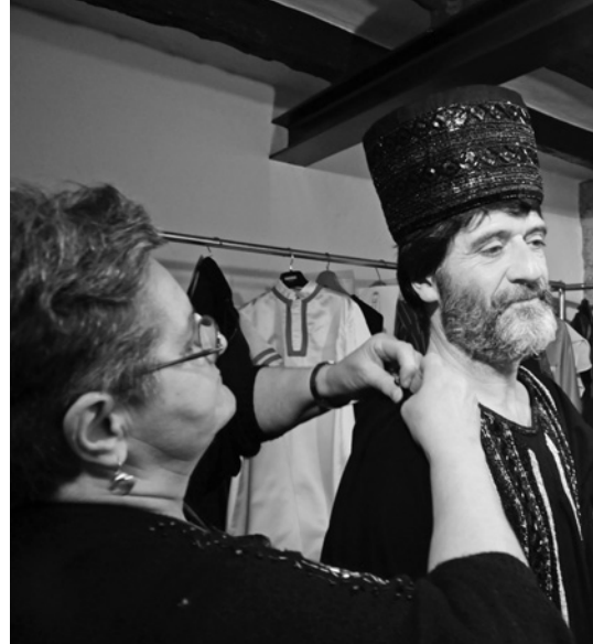
La nit del Dijous Sant, ajudant a vestir un sacerdot del Sanedrí

Mai com ara no havia vist tanta gent interessada en la Processó, en els Reis, en la Sopa... Les que havíem cosit parracs ara