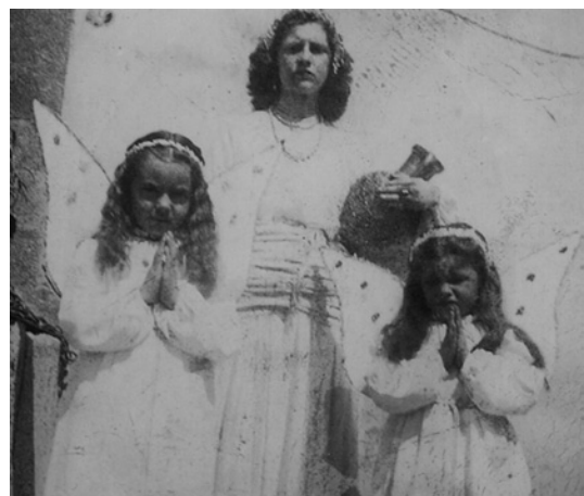
Fent d'angelet de la Samaritana

D. PARETA, J. ROCA I ARXIU FAMILIAR (CONVERSA I FOTOS) JORDI ROCA I ROVIRA (TEXT)