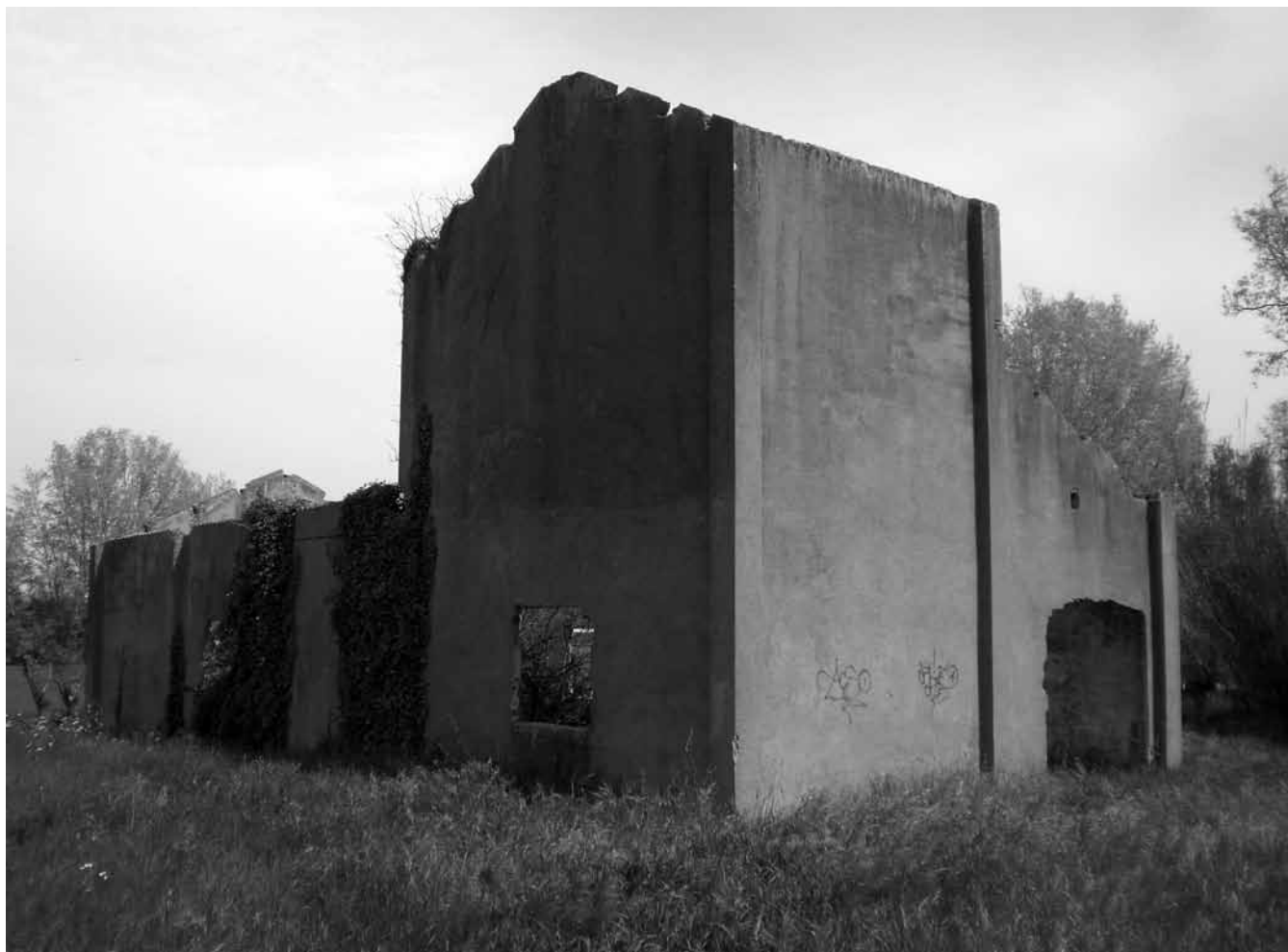
Cos de guàrdia - Taller

mas es convertí en el quarter general del camp, una vertadera caserna on els oficials i els soldats destinats a la vigilància feien vida de quarter comandats per un capità. La casa dels masovers es convertí en allotjament dels oficials de guàrdia –que, quan lliuraven, s’hostatjaven a la Fonda Mas Pi de Verges–, oficines i magatzem d’armament (sobretot bombes de mà), mentre que les quadres de vaques i cavalls es convertiren en els dormitoris dels soldats.