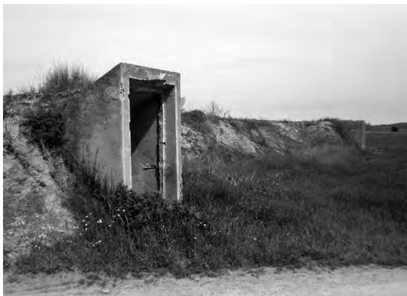
Refugi del mas d'en Mach

Seguirem pel camí principal, deixarem enrere un trencall que condueix a unes sorreres i, immediatament, trobarem una granja de porcs. El refugi antiaeri del camp d'en Canet és idèntic a l'anterior, i frega el límit nord dels terrenys de la granja, tocant al camí. Actualment està completament colgat de vegetació, cosa que el fa molt difícil de trobar i n'impossibilita