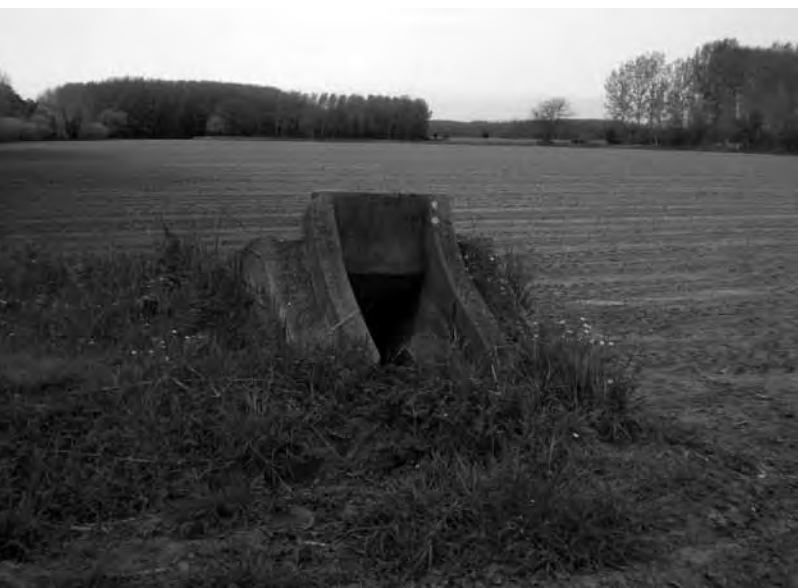
Refugi del camp d'en Canet

A banda de l'habilitació de la pista —o pistes— d'ateratge, element fonamental de qualsevol aeròdrom, en tots els camps també es portava a terme la construcció d'altres elements bàsics per al seu bon funcionament. Actualment, tres quarts de segle més tard, la majoria d'aquelles construccions encara resten visibles, cosa que ens permet de fer-nos una idea molt precisa de com va ser el camp d'aviació republicà de Canet de Verges. Val la pena d'acostar-s'hi i, tot passejant, descobrir el terreny que ocupaven les dues pistes, la caserna, el taller, els refugis antiaeris, els llocs on s'estacionaven els avions, la «torre de control», etc.